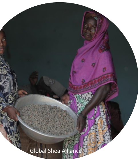
Global Shea Alliance